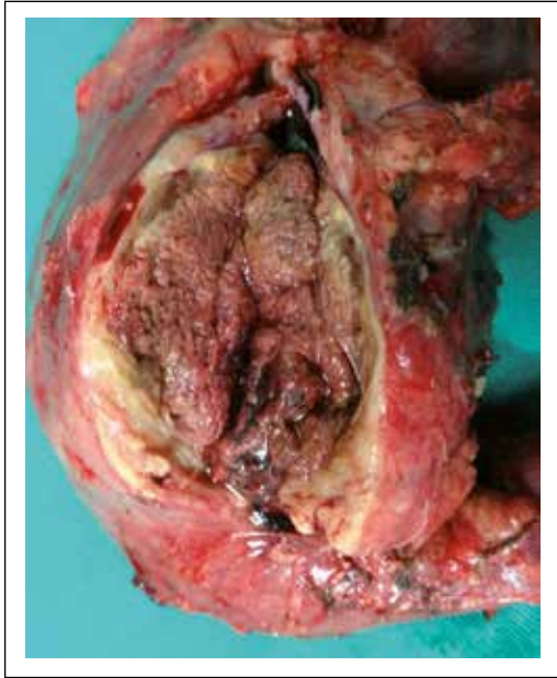
Figura 2. Tumoración de patrón de crecimiento expansivo, bien circunscrita, con extensa necrosis y hemorragia rodeada por tejido amarillento fibroso en sus bordes.

panqueratina y e-caderina negativo. La neoplasia tuvo un patrón de crecimiento expansivo, con extensa necrosis isquémica, rodeado por pseudocápsula fibrosa gruesa incompleta. Hubo invasión perineural focal, sin invasión vascular. Bordes de sección de estómago, duodeno, páncreas y colédoco libres de neoplasia. Se encontraron 30 ganglios linfáticos regionales libres de neoplasia (Figura 3).