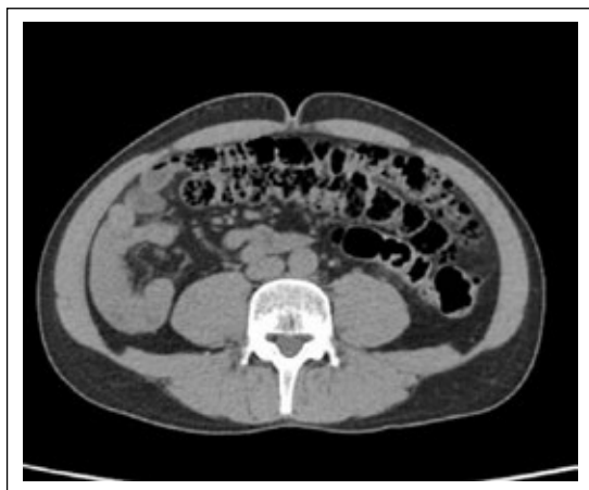
Figura 3. Tomografía de abdomen contrastada (corte axial) con evidencia de cambios inflamatorios significativos dentro de la grasa mesentérica que rodean el ciego y el engrosamiento de la pared del ciego que se encuentra rotado en la fosa ilíaca izquierda.

representa un defecto en la embriogénesis durante la quinta semana de desarrollo fetal. En esta etapa el intestino se divide en intestino anterior, medio y posterior de acuerdo al aporte sanguíneo dado por el tronco celíaco para el intestino anterior, por la arteria mesentérica superior (AMS) para el intestino medio y por la arteria mesentérica inferior para el intestino posterior. El intestino medio se expande rápidamente en la cavidad abdominal se prolapsa dentro del cordón umbilical aproximadamente a la sexta semana y retornando a la cavidad abdominal en la 4 a 6 semanas después para girar 90° en sentido contrario a las manecillas del reloj alrededor de la AMS quedando las asas delgadas al lado derecho y las gruesas al lado izquierdo. En una segunda rotación de 180° las asas delgadas pasan posteriores a la AMS desplazando el ciego del cuadrante superior derecho al cuadrante inferior derecho. El duodeno rota por detrás de la AMS y el colon rota anteriormente, el duodeno entonces es fijado retroperitonealmente por el ligamento de Treitz, mientras que el ciego es fijado a la pared abdominal lateral en el cuadrante inferior derecho configurando una base amplia del mesenterio del intestino delgado que se fusiona con el peritoneo posterior en dirección