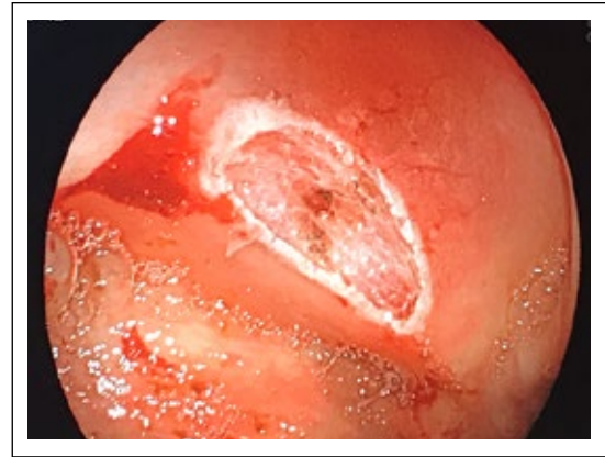
Figura 2. Lecho de polipectomía con asa diatérmica en ciego.

Análisis de laboratorio hemograma con leucocitosis 13 800 células/mL con neutrofilia 80%. Se realiza escanografía abdominal con evidencia de malrotación intestinal y cambios inflamatorios significativos dentro de la grasa mesentérica que rodean el ciego y el engrosamiento de la pared del ciego que se encuentra rotado en la fosa ilíaca izquierda sin signos de perforación (Figura 3 y 4). Se diagnosticó malrotación intestinal congénita y síndrome de electrocoagulación pospolipectomía; fue tratado de forma conservadora con líquidos intravenosos, ampicilina sulbactam 3 g endovenosa cada 6 horas, nada vía oral. Su dolor abdominal se resolvió a las 48 horas, resolución de leucocitosis y de signos de respuesta inflamatoria sistémica. Fue dado de alta con ATB oral, informe resolución completa de sus síntomas en el control de seguimiento.