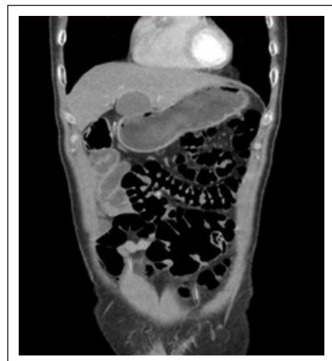
Figura 4. Tomografía de abdomen contrastada (corte coronal) pared del ciego que se encuentra rotado en la fosa ilíaca izquierda.