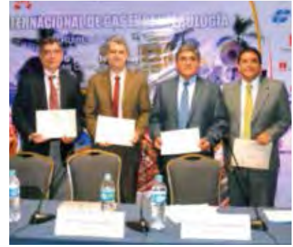
Figura 3. Arequipa 2013.

como de aquellos que trabajan en lugares alejados de la capital, y por la continua evolución y desarrollo de la endoscopia terapéutica, propuse la implementación de un local ad-hoc en nuestra sede institucional para que funcione allí un anfiteatro con capacidad para 45 personas donde pudieran llevarse a cabo este tipo de actividades.