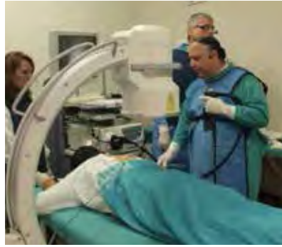
Figura 2. Chiclayo 2013.