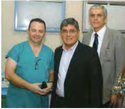
Figura 1. Curso Internacional AIGE.