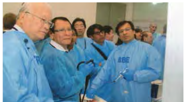
Figura 5. Centro de Entrenamiento Sociedad de Gastroenterología del Perú.

Este pequeño gran paso nos coloca a la altura de las grandes instituciones y nos abre una puerta de incommensurables posibilidades que dependerá de nosotros mismos saber utilizarla.