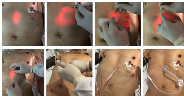
Figura 1. Técnica de gastrostomía endoscópica percutánea.