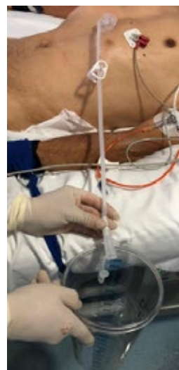
Figura 3. Evaluación del residuo gástrico por gravedad, conectando la sonda a un reservorio.