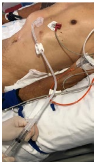
Figura 2. Evaluación del residuo gástrico mediante aspiración con jeringa.