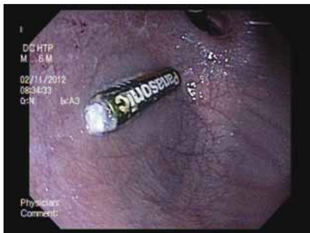
Figura 2. Durante la endoscopia, a la maniobra de retroflexión, se observa una batería cilíndrica AA en el fondo gástrico. En el extremo se observa una secreción blanquecina probablemente por fuga de la sustancia alcalina. No se observan lesiones en mucosa.

El paciente fue programado para una extracción endoscópica bajo anestesia general, el cual se realizó a las 6 horas de ingesta. Durante el procedimiento se encontró el cuerpo extraño en el fondo gástrico (Figura 2), sin evidencia de lesiones en la mucosa gástrica. Posteriormente se procedió a su extracción usando una canastilla de Dormia sin complicaciones (Figura 3).