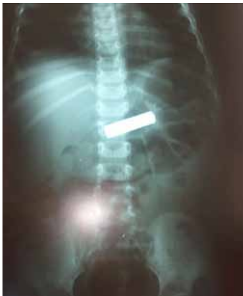
Figura 1. Radiografía de abdomen que muestra un cuerpo extraño radio opaco cilíndrico en la cavidad gástrica.

La radiografía tóraco abdominal mostró el cuerpo extraño radio opaco en la cavidad gástrica (Figura 1).