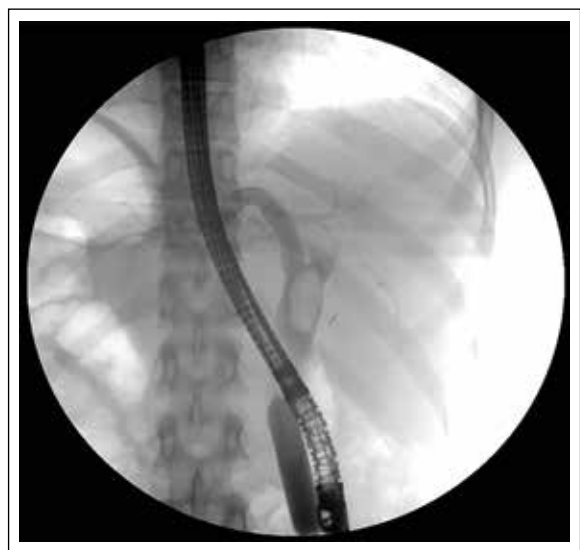
Figura 1. Imagen fluoroscópica de la insuflación del balón de dilatación en la papila. Nótese la ubicación de la guía en uno de los conductos intrahepáticos.

La información se introdujo en una base de datos confeccionada en el programa Microsoft Excel para Windows versión 2010 y para el análisis se utilizó Stata versión 12.0. Se realizó un análisis descriptivo de la población incluyendo edad, sexo, cuadro clínico de presentación, número y tamaño de los cálculos, diámetro de las dilataciones, éxito terapéutico, complicaciones en general y complicaciones específicas. Se reportan el promedio, desviación estándar y rango del mínimo