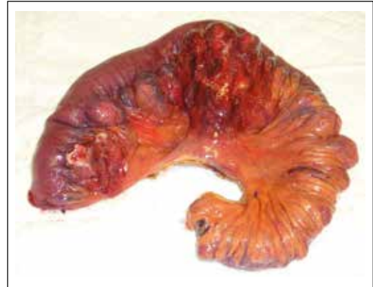
Figura 2. Macroscópica de divertículos yeyunales.

Para identificar los casos, se analizaron los archivos de anatomía patológica y la base de datos del Servicio. Fueron intervenidos 12 pacientes por complicaciones asociadas a la presencia de DYI.