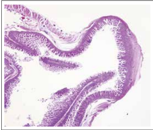
Figura 1. Microscopia de diverticulosis intestinal. La mucosa y submucosa intestinal se invagina, a modo de "dedo de guante" a lo largo de la pared de intestino delgado, sobrepasando la capa muscular y quedando en íntimo contacto con la delgada.

Es clínicamente silente, aunque se han descrito síntomas como dispepsia, dolor abdominal epigástrico crónico, anemia y malabsorción intestinal. Las complicaciones agudas más comunes incluyen la diverticulitis, hemorragia y obstrucción intestinal.