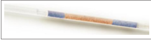
Figura 1. Tubo indicador con cambio de color positivo (18) .

formaldehído para ser enviadas al Servicio de Patología del HCH. Posteriormente se incluyeron en parafina, se realizaron cortes de 5 micras de espesor teñidos con hematoxilina-eosina y tinciones de plata para evaluarlas con un microscopio óptico por patólogos del HCH. La positividad de la prueba histológica se define por la visualización de HP en el corte y se reporta como positivo o negativo. La prueba histológica se utilizó como estándar de oro.